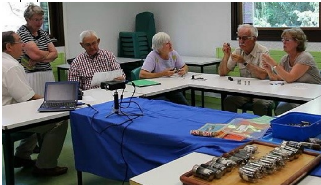
Figure 3 : une causerie sur les « tubes à oxyde » en présence d'opératrices avec leur agent de maîtrise ainsi que du directeur technique et de la secrétaire de direction de l'époque

Ces « causeries » sont filmées pour être mises en ligne sur le site internet de Tedimage38 6 où de nombreux autres documents historiques sont présentés. On trouve pour le moment sur ce site les causeries sur un tube à rayon cathodique remarquable fabriqué pour un avion à décollage vertical, le V22 de Boeing, sur les « tubes à mémoire » depuis leurs origines dans les années 50 jusqu'à la fin de l'activité en 1998 et bientôt sur les « tubes à oxydes » fabriqués pour les télécommunications.