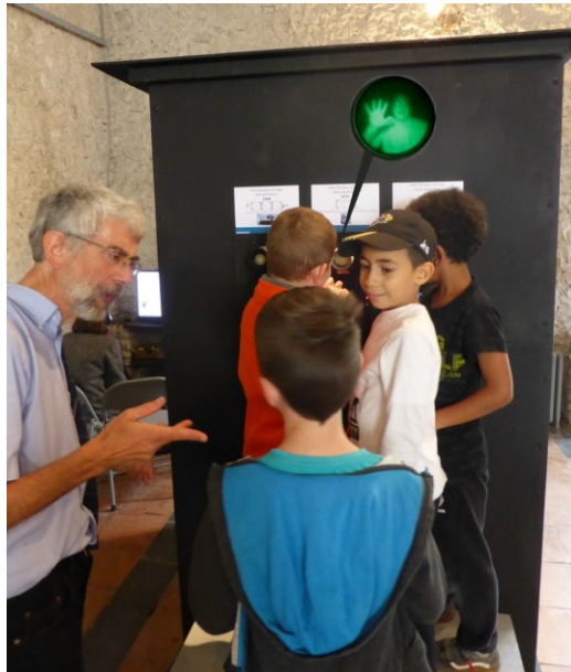
Figure 4 – Un classe de CM2 découvre la vision nocturne avec des appareils fabriqués dans les années 80

Pour sa première exposition destinée au grand public, l'association a réalisé un démonstrateur de vision nocturne sous la forme du « Mystère de la chambre noire » : une cabine plongée dans l'obscurité dans laquelle un visiteur est invité à entrer pour être observé par d'autres visiteurs, restés à l'extérieur, grâce à différents intensificateurs d'image lumineuse qui ont pu être remis en état de marche alors qu'ils dormaient dans des caisses depuis plus de 20 ans.